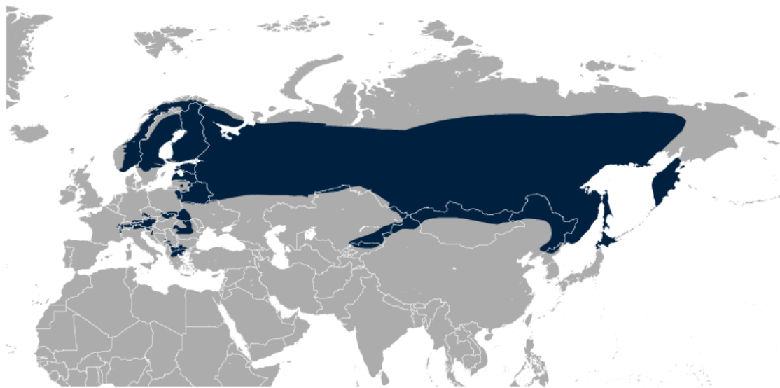
Фиг. 1 Карта на световното разпространение на трипръстия кълвач

В някои таксономии последните три подвида, обитаващи Северна Америка, са обединени в подвида P. t. dorsalis .